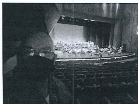
Grabación de audio en Teatro Nacional

1. Se dio apoyo a la Dirección General de las Artes para la grabación de Audio de la Orquesta Sinfónica Nacional y la Marimba Guatemala, del Ballet Moderno y Folclórico para la realización de la actividad que se llevará a cabo el día 21 de diciembre en el Centro Ceremonial Takalik Abaj. Se coordinó los grupos artísticos (horarios, espacios físicos y la adecuación de los tiempos musicales para la adecuada ejecución dancística).