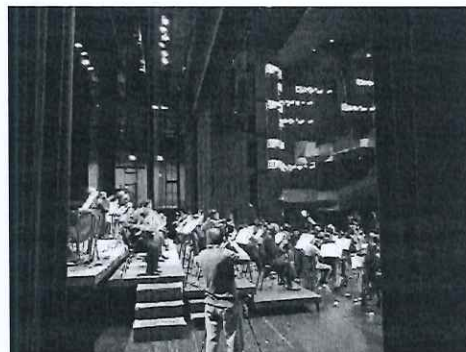
Grabación de audio en Teatro Nacional